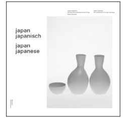
japan japanese the quiet beauty of things japanese helmut schmid robundo publishing inc. 3,800 yen