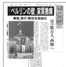
typographic reflections 1 1989 11 09 the berlin wall falls lead of the asahi newspaper