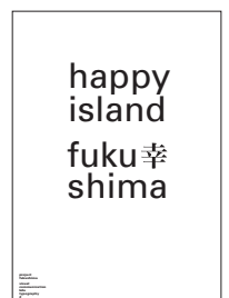
project fukushima reflected by mayuko morimoto kobe design university